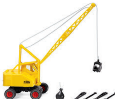
0662 05 Seilbagger (Fuchs F 301) Mit neuer Hochauslegerlagerung UVP 19 %: 23,99 € / UVP 16 %: 23,39 € · 1959-70

Wiking-Modellbau GmbH & Co. KG · Schlittenbacher Str. 60 · 58511 Lüdenscheid · info@wiking.de · www.wiking.de