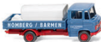
0271 02 Pritschenwagen mit Aufsatztank (MB L 408) Heizöl für Kleinverbraucher UVP 19 %: 16,99 € / UVP 16 %: 16,56 € · 1967-71