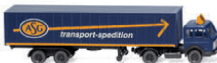
0950 03 Containersattelzug (MB) Spur N 1:160 ASG in Spur N UVP 19 %: 11,99 € / UVP 16 %: 11,69 € · 1989-94