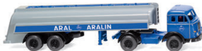
0882 47 Tanksattelzug (Henschel) Typischer Aral-Großtankwagen UVP 19 %: 23,99 € / UVP 16 %: 23,39 € · 1955-61