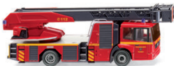
0627 03 Feuerwehr Lübeck – Metz DL 32 (MB Eonic) UVP 19 %: 28,89 € · Jetzt: UVP 19,99 €