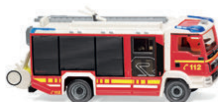
0612 44 Feuerwehr – AT LF (MAN TGM Euro 6/Rosenbauer) Neue Modellkombination des Alleskönners UVP 19 %: 35,99 € / UVP 16 %: 35,08 €