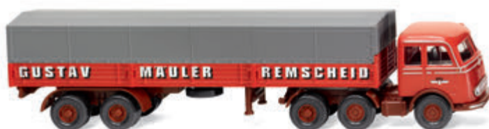
0488 04 Pritschensattelzug (MB LPS 333) Tausendfüßler im Mäuler-Einsatz UVP 19 %: 23,99 € / UVP 16 %: 23,39 € · 1958-61