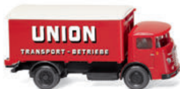
0476 03 Koffer-Lkw (Büssing 4500) Erstaustritt als Koffer-Variante UVP 19 %: 16,99 € / UVP 16 %: 16,56 € · 1953-55