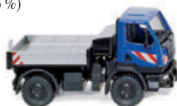
0369 02 Unimog U 20 UVP 19 %: 13,69 € · Jetzt: UVP 8,99 €