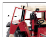
0778 52 IHC 1455 XL Der Kultschlepper im Großformat UVP 19 %: 89,95 € / UVP 16 %: 87,68 €