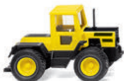
0385 97 MB Trac Allradtechnik aus Gaggenau UVP 19 %: 13,99 € / UVP 16 %: 13,64 € · 1975-80