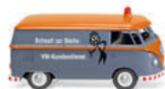
0797 27 VW T1 Kastenwagen Kult-Bulli im Servicedienst UVP 19 %: 18,49 € / UVP 16 %: 18,02 € · 1963-67